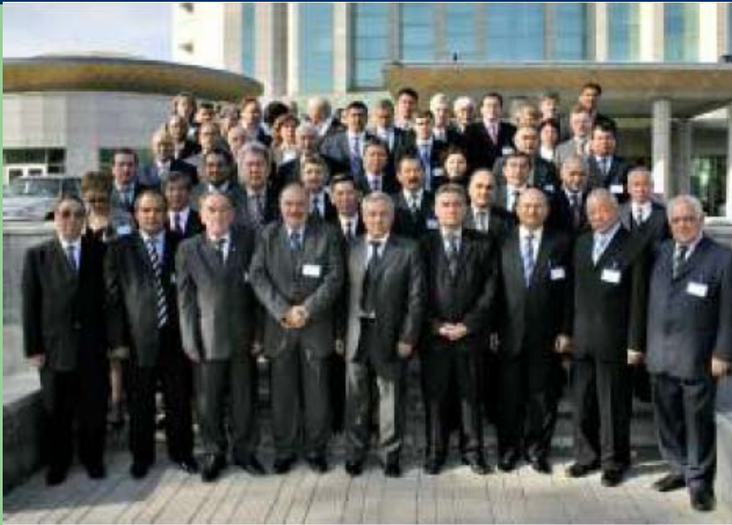
Совещание по определению приоритетов сельскохозяйственных исследований, 7-9 марта 2007 года