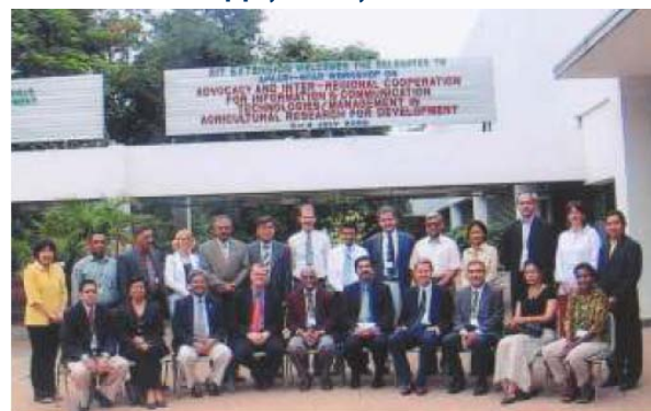
Межрегиональное совещание ИТ-специалистов, 03-04 июля, 2006 года, Бангкок, Таиланд