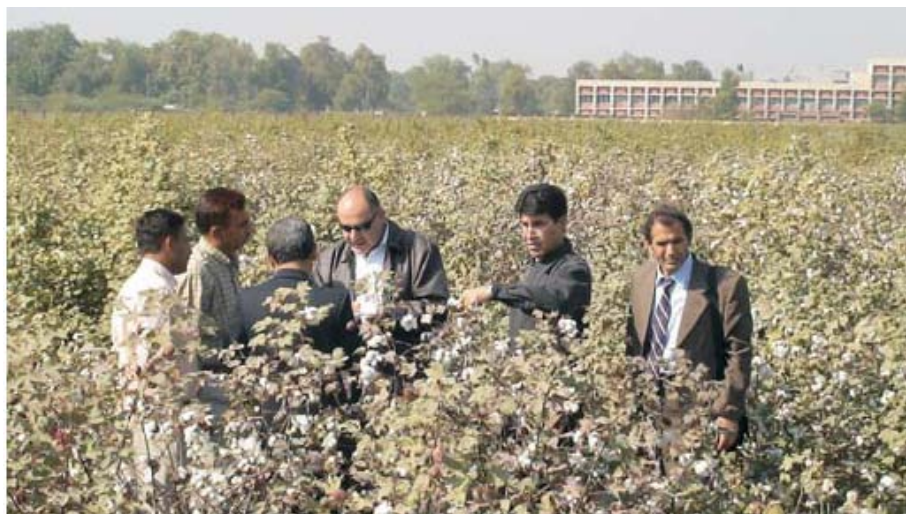
Рабочее совещание ИНКАНА по ГМО хлопчатнику, 21-26 ноября, 2005 года, Индия