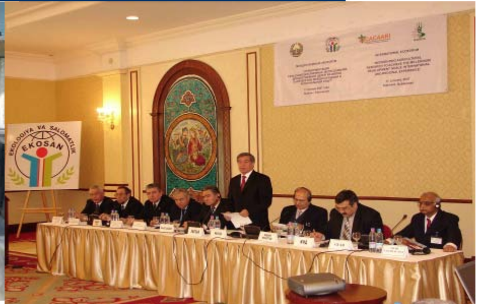
Международный форум по переориентации сельскохозяйственной науки для достижения целей развития тысячелетия, 17 января 2007 года, Ташкент, Узбекистан