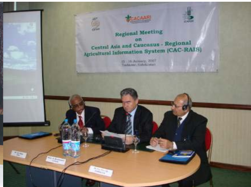
2-ое Совещание РСИС-ЦАЗ 15-16 января, 2007 Ташкент, Узбекистан

Участие в межрегиональном совещании РСИС в Каире, Египте, в мае 2005 года