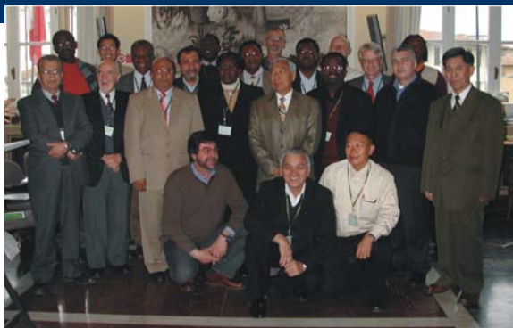
Совещание ГФСХИ, 1-3 февраля, 2004 года