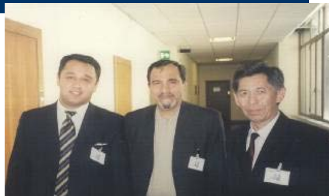
Совещание Исполнительных секретарей, 17-18 мая, 2004 года, Рим, Италия