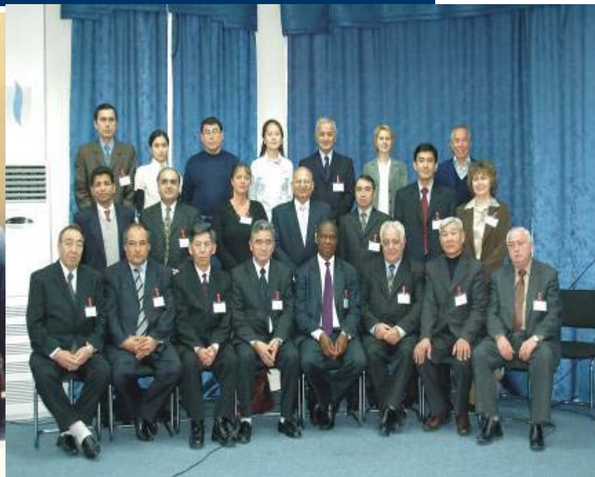
Рабочее совещание ИФПРИ – АНИИЦАЗ по “Переориентации управления научно-исследовательских работ и Инновационная система в Центральной Азии и Закавказье» , Ташкент Узбекистан, 11-12 февраля 2006 года