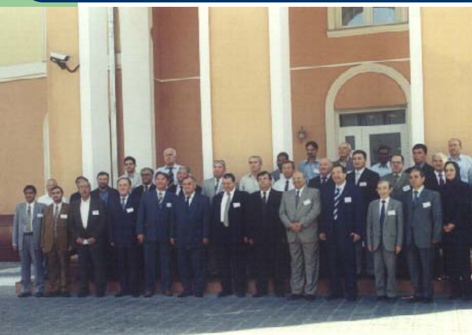
2-ое совещание ИНКАНА, 6-8 сентября 2004 года, Ташкент, Узбекистан