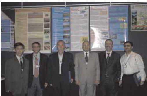
14-ое Совещание Руководящего Комитета ГФСХИ, 22-25 октября 2004 года, Мексика,