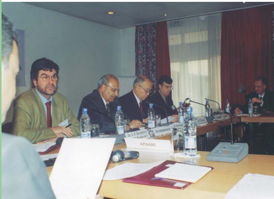
1-ое Совещание РСИС-ЦАЗ 27-28 января, 2004 Ташкент, Узбекистан