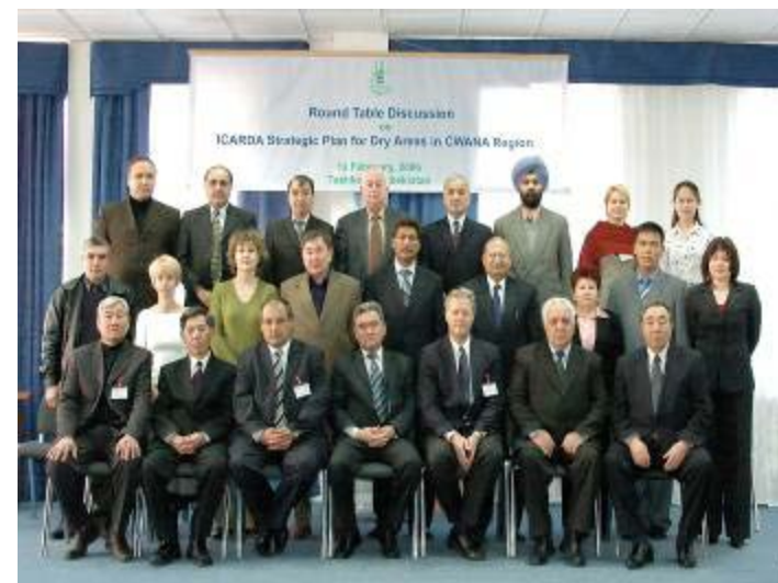
Совещание ИКАРДА-АНИИЦАЗ по Стратегическому плану в засушливых регионах ЦЗАСА Ташкент, Узбекистан, 12 января, 2006

22-24 мая 2003, Совещание ГФСХИ, Дакар, Сенегал